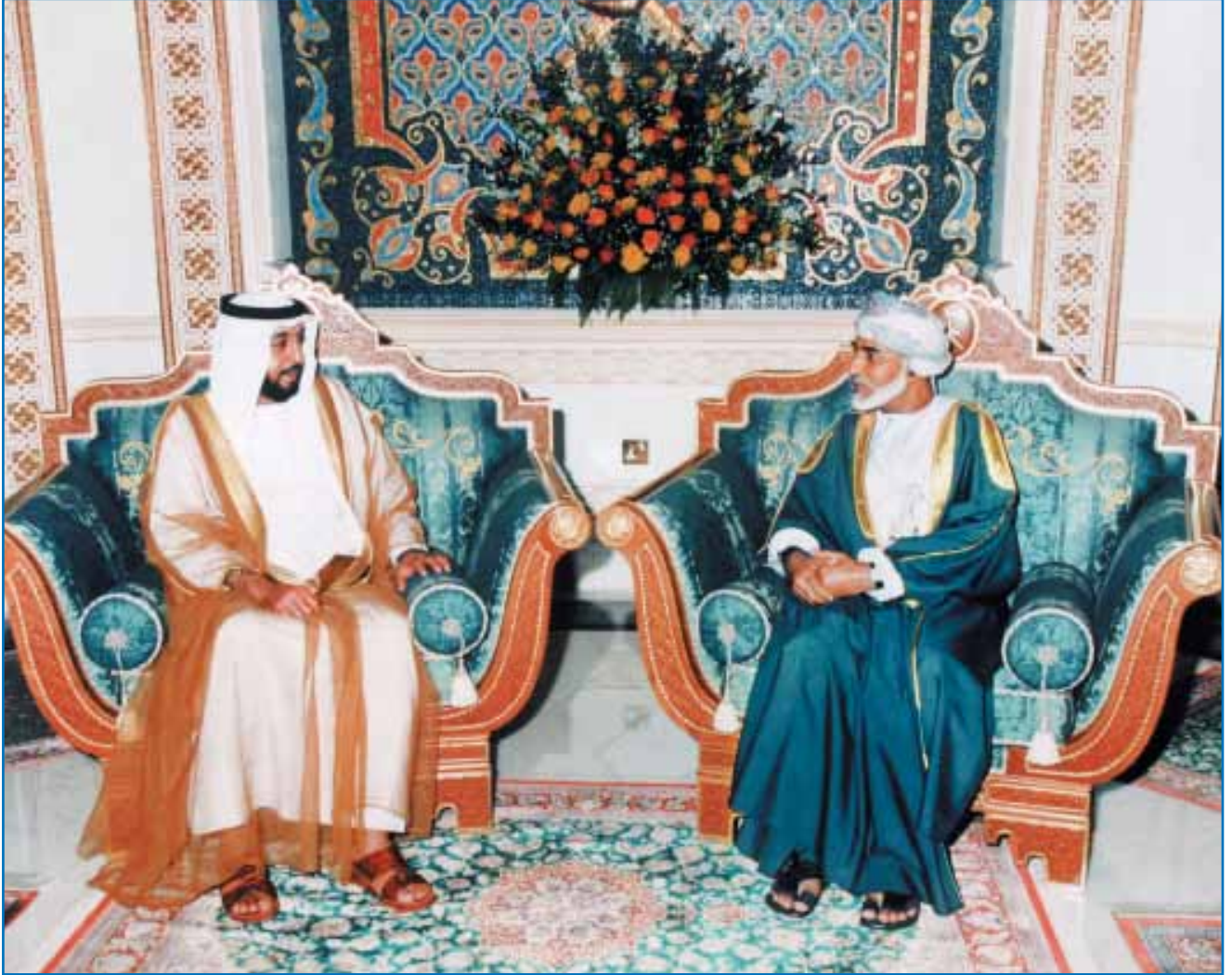
صاحب السمو الشيخ خليفة بن زايد آل نهيان رئيس دولة الإمارات العربية المتحدة